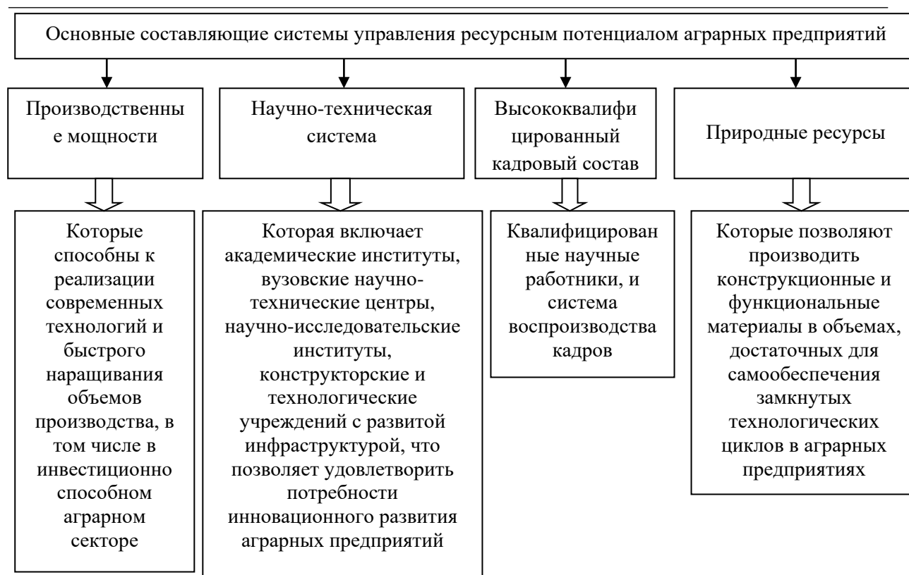
Рисунок 2. Основной состав системы управления ресурсным потенциалом аграрных производств