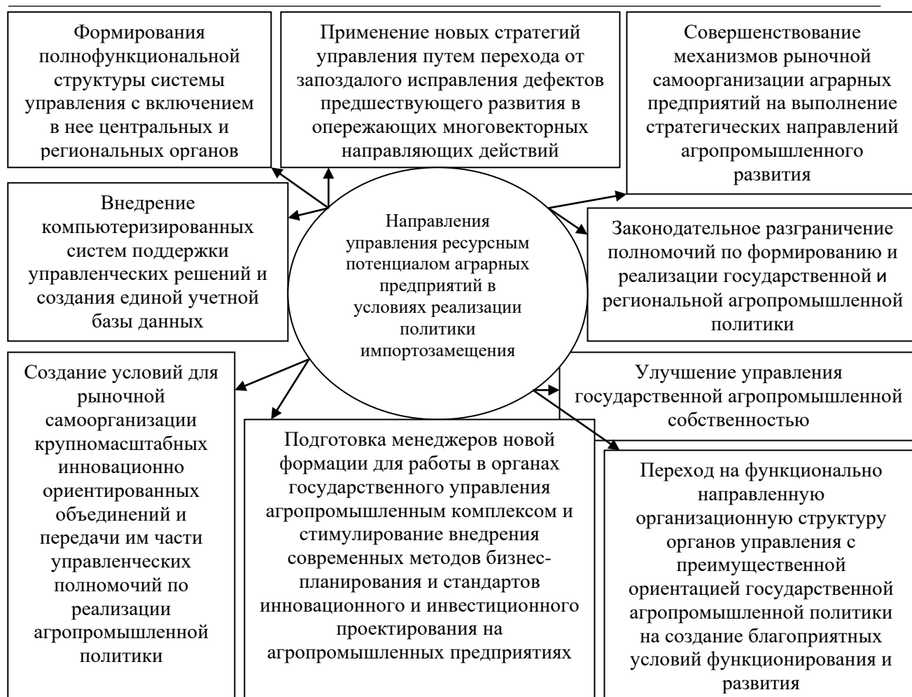
Рисунок 3. Основные направления управления ресурсным потенциалом аграрных предприятий в условиях политики импортозамещения

При разработке и реализации государственной аграрной политики должен учитываться весь арсенал форм и методов воздействия государства на деятельность аграрных предприятий, основные направления приложения усилий необходимо направить на обеспечение регуляторной деятельности и ориентации на лучшие международные практики управления.